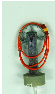
Elektrant, neue Ausführung der RhB für 320VAC und 990VAC. Fertigmodell.

und Klimatisierung abgestellter Reisezug-wagen sind an vielen grösseren Stationen solche Säulen mit Anschlusskabel aufgestellt.