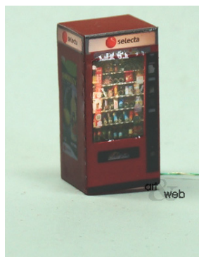
Selecta Automat mit LED

Selecta Snack Automat mit LED Beleuchtung.